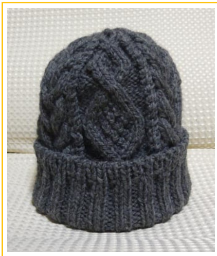
オリムパス ジョンレノン LIFE (ウール 100%) 3玉 (150g 150m)

ケーブル部分は意外と伸びるので、 サイズは、ゴム編みの目数で多少調整できます。 ゴム編み部分の長さは見本は 12cm ですが お好みで増減してください。 試し編み推奨。